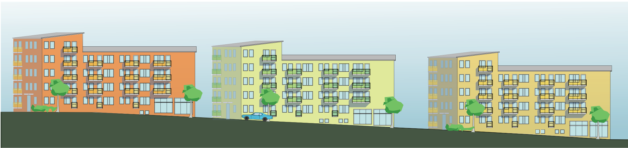
Östra kvarterets fasader mot Södergatan