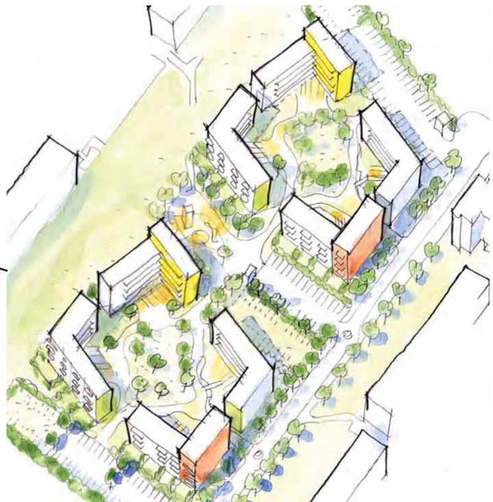
Kvarter Södergatan Norr

Södergatan Norr Här planeras 2 kvarter med 4/5 -våningshus med ca 175 bostäder. Trolig byggstart 2010.