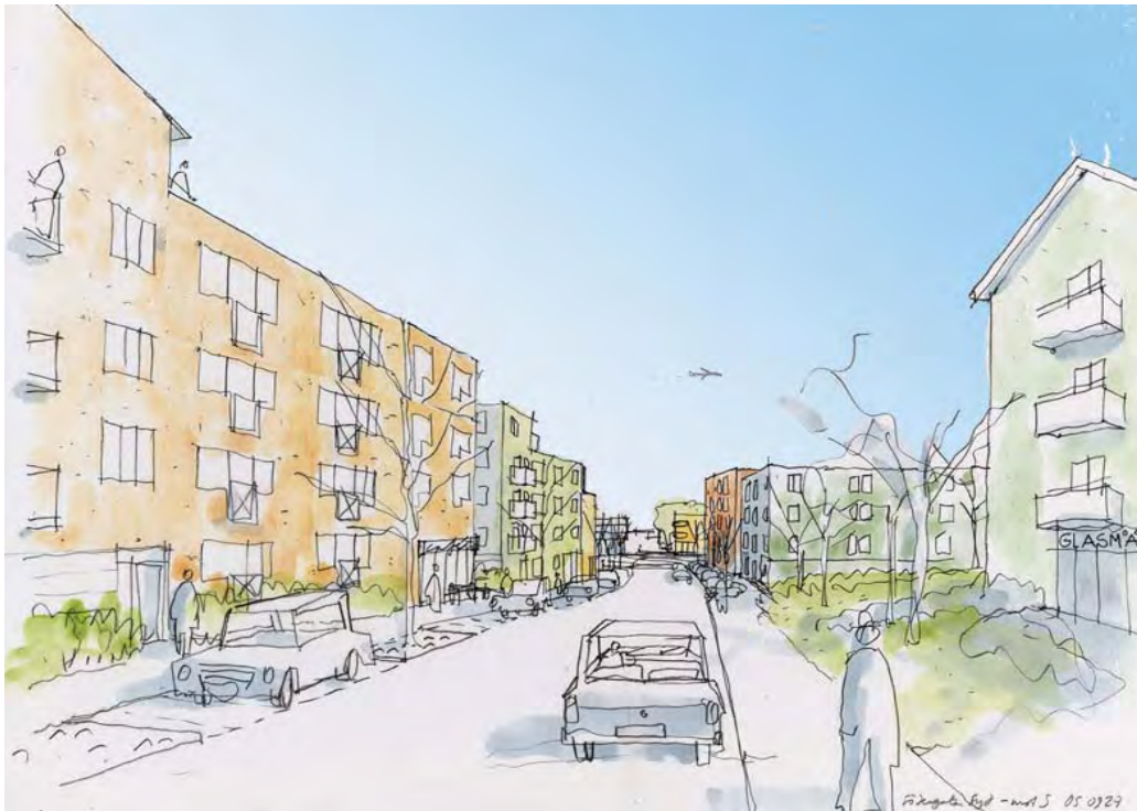
Södergatan ner mot Märsta centrum