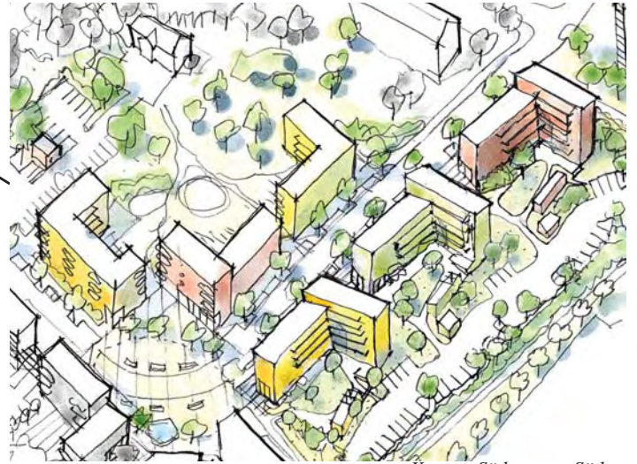
Kvarter Södergatan Söder

Södergatan Norr Här planeras 2 kvarter med 4/5 -våningshus med ca 175 bostäder. Trolig byggstart 2010.