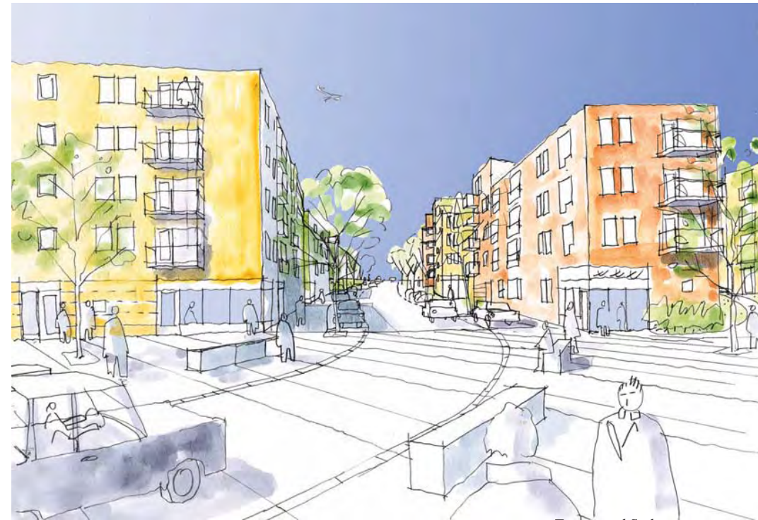
Torget med Södergatan norrut