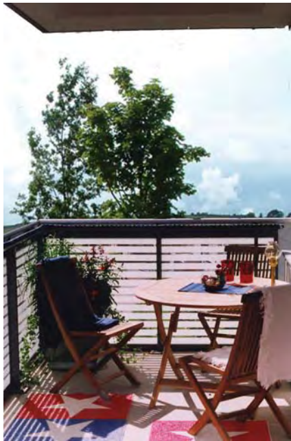
Exempel på balkonger och loftgångar med glasade fronter

De L-formade husen i östra kvarteret har entréer både mellan husen och från gårdarna. Husen har invändiga trapphus och korta loftgångar som i sina ändpunkter blir privata entrébalkonger. Lägenheter i entréplan mot gatan har sin golvnivå ca 1 meter över mark så att insyn förhindras. I entréplan mot gården ligger en gavellägenhet i markplan med egen uteplats. Där finns även lokaler med högre takhöjd för exempelvis butik eller kontor. I entré- och källarplanet finns vidare tvättstuga och lägenhetsförråd. Gårdarna är gröna och trädbevuxna med skyddade uteplatser. Här finns även cykel- och trädgårdsförråd, pergola mm. Balkonger och loftgångar har fronter av glas och ligger i soligt väderstreck och ska vara attraktivt utformade även för utvistelse och social samvaro.